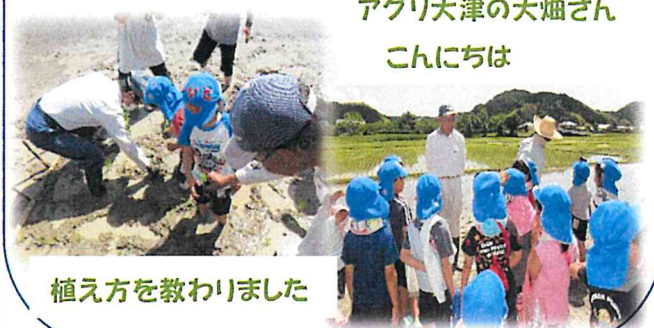
植え方を教わりました