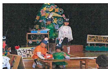
得意な事 見て見て