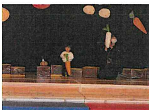
カレーにはやっぱり人参！