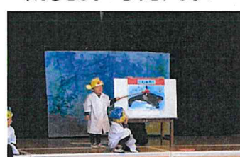
僕たちは海の博士だよ！