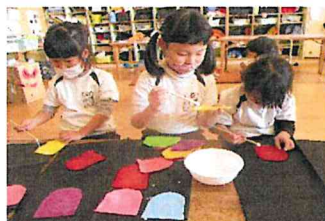
虹魚の衣装を作るんだ！