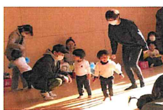
ママ しっぽとって〜