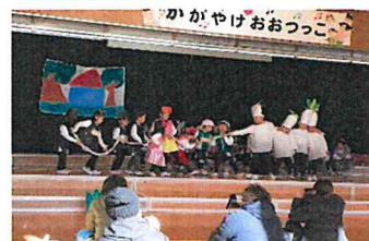
うんとこしょ！どっこいしょ！