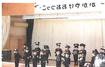
おまわりさんになりきって！