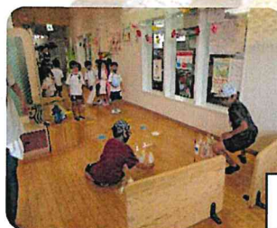
学校給食センターに避難しました